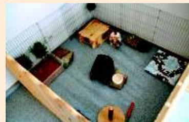
Beispiel Zaungebege in einer Wohnung

Ideen gibt es unter www.Kaninchenwiese.de oder im Gespräch bei uns im Tierheim.