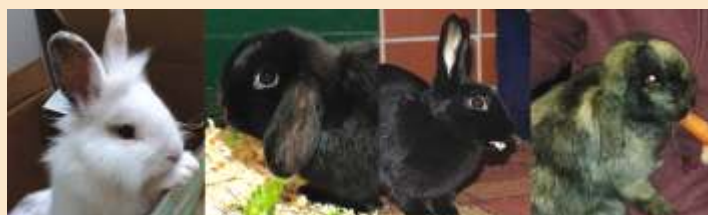
Rafki (männl.), Murbeline (weibl.), Nickel, (weibl.) und Bernadette (weibl.) sind Fundtiere, die ein liebevolles, käfigfreies, gesundes Zubause suchen.